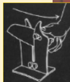
Litt sløve kniver